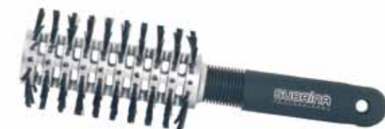
HAIR BRUSH 9930PD-RX