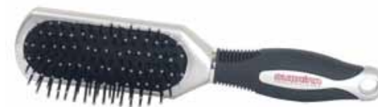
HAIR BRUSH 9550L-BUX