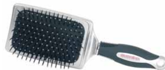
HAIR BRUSH 2086L-BUX