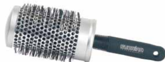
HAIR BRUSH 9509D-R