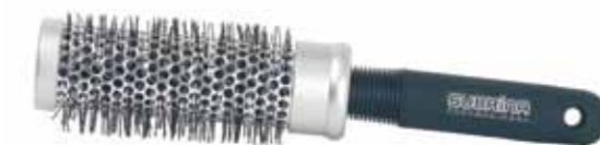
HAIR BRUSH 9516D-R