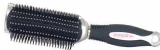
HAIR BRUSH 9553L-BUX